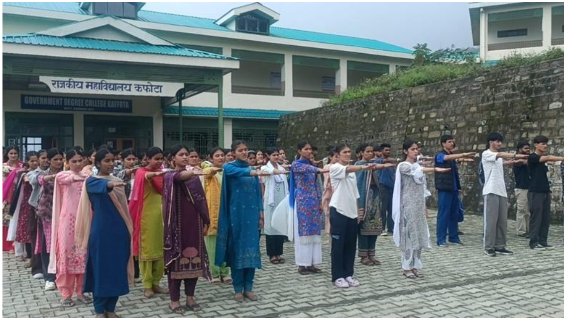
Figure 3: Oath taking by students on Anti-Drug