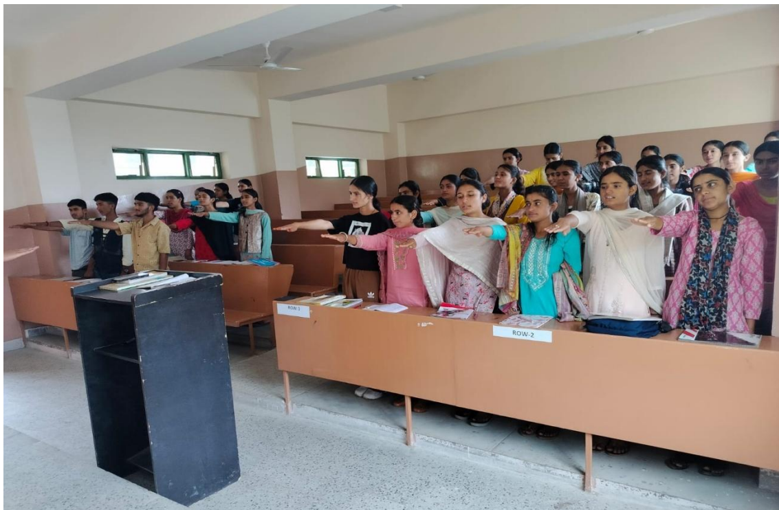
Figure 4: Students taking anti-drug pledge